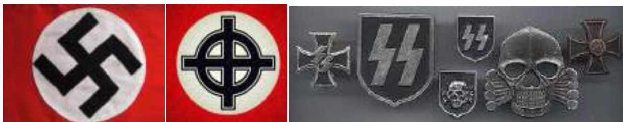
Рисунок 10. Нацистская атрибутика и символика.

Атрибутики, символики запрещенных в Российской Федерации экстремистских и террористических организаций: