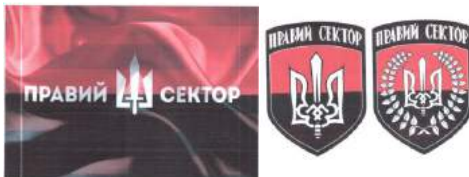
Рисунок 11. Атрибутика организации «Правый сектор».