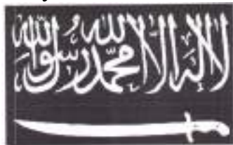
Рисунок 13. Символика организации «Кавказский эмират» («Имарат Кавказ»).