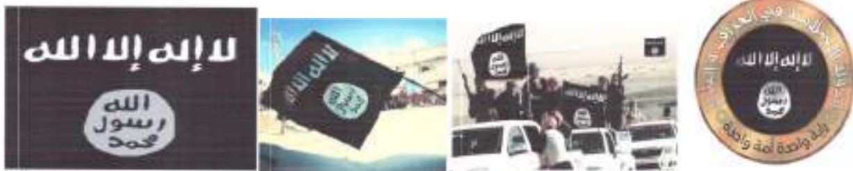
Рисунок 12. Символика организации «Исламское государство».