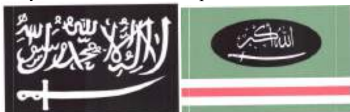
Рисунок 14. Символика вилайетов (административно-территориальных образований) организации «Кавказский эмират» («Имарат Кавказ»).

Отсутствие осознания общественной опасности террористических проявлений подростком может выражаться в наличии в публикациях на его странице или странице его друзей, а также страницах сообществ (групп), в которых он состоит (на которые подписан), информационных материалов, оправдывающих совершение преступлений экстремистской и террористической направленности, в том числе на территории зданий органов государственной власти и местного самоуправления.